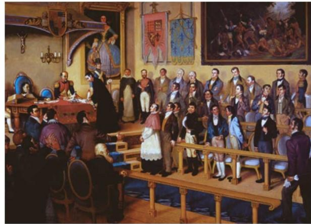
Figura 1. Las obras: El Constituyente de 1811 y La firma del acta de independencia de Centroamérica.

Nota: El Constituyente de 1811 (Martín Tovar y Tovar). Arriba izq., (Ilustración sobre el original en el texto de Rojas, 1884). Arriba der, (Fotografía del cuadro original, Palacio Federal Legislativo, Venezuela). Abajo izq., (Imagen empleada en recurso didáctico de la universidad y en publicaciones digitales). La firma del acta de independencia de Centroamérica (Luis Vergara Ahumada) Abajo der.