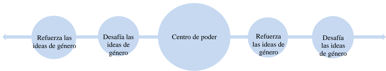
Figura 2. Representación de performatividad de género en términos de poder.

En palabras de Ferreira (2013) se puede concluir que: