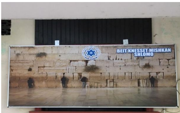
Figura 2. Señalización de Beit Knesset Mishkan Shlomo.

La sinagoga está en una modesta casa en el Barrio Suyapa en San Pedro Sula, Honduras. Su exterior es sencillo y difícil de ser vista por alguien que no la busque. Solo un rótulo interno describe su carácter religioso (Figura 2). El espacio ha sido reorganizado para separar las secciones de acuerdo con género. La sección contiene el arca de la Torá y la sección masculina de oración. La mesa es utilizada para las cenas comunales de Shabat (Figura 3). En la visita, se constató que no se han realizado renovaciones mayores a su infraestructura.