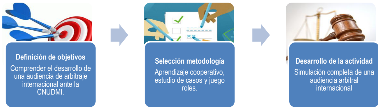
Figura 1. Ilustración de las tres fases que estructuraron la estrategia implementada.

Definición de objetivos: la primera etapa de la innovación consistió en la definición de objetivos. Toda actividad debe contar con metas claras; en este caso, tal como se indica en la Figura 1, el objetivo principal es comprender el proceso de arbitraje internacional ante la CNUDMI, realizando una audiencia simulada.