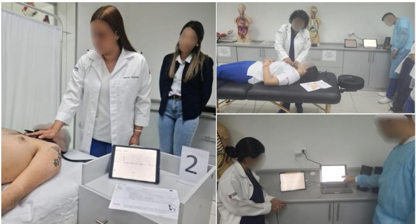
Figura 2. Estaciones de la PLA donde los estudiantes de las licenciaturas en Enfermería y, en Terapia Física y Ocupacional participaron y muestran los elementos que se requieren para el examen de fisiología cardíaca: fonocardiograma y electrocardiograma.